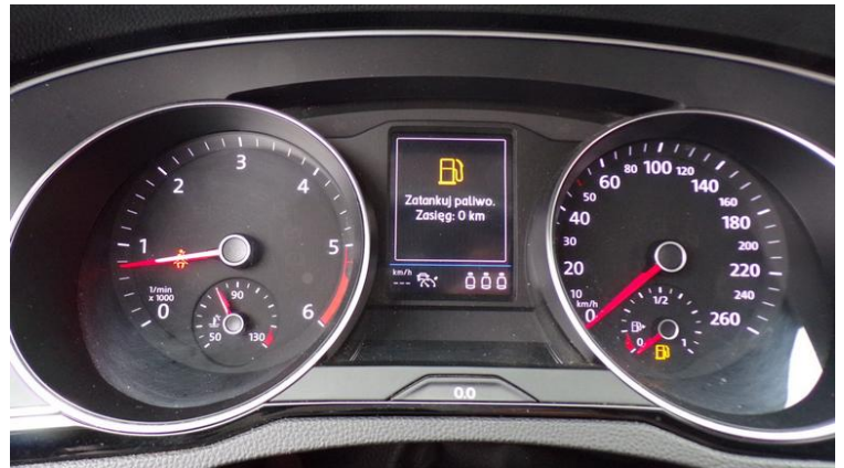
Fot. nr 82