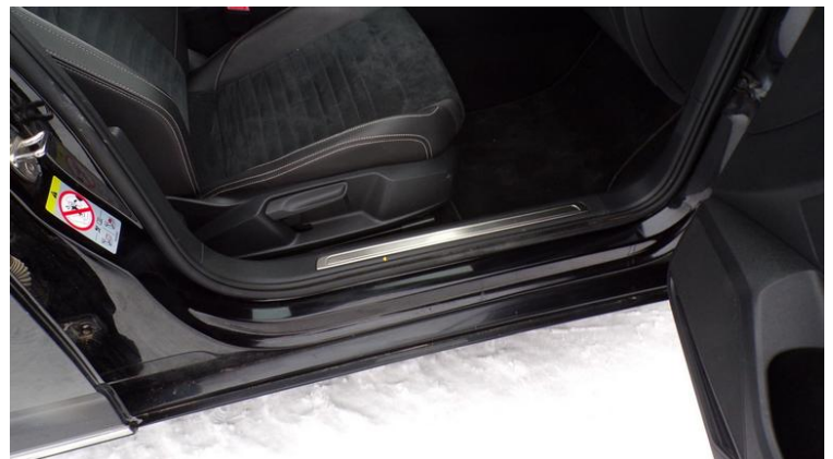
Fot. nr 90