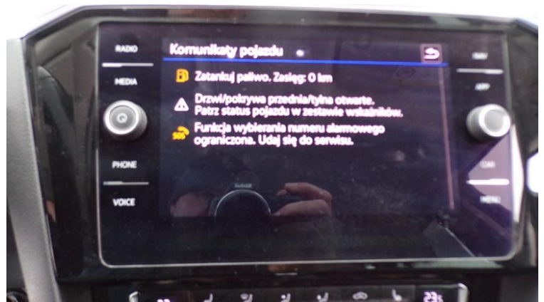
Fot. nr 78