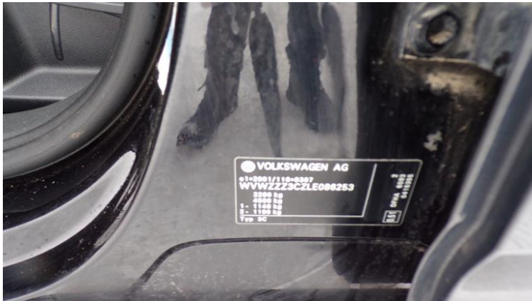
Fot. nr 85