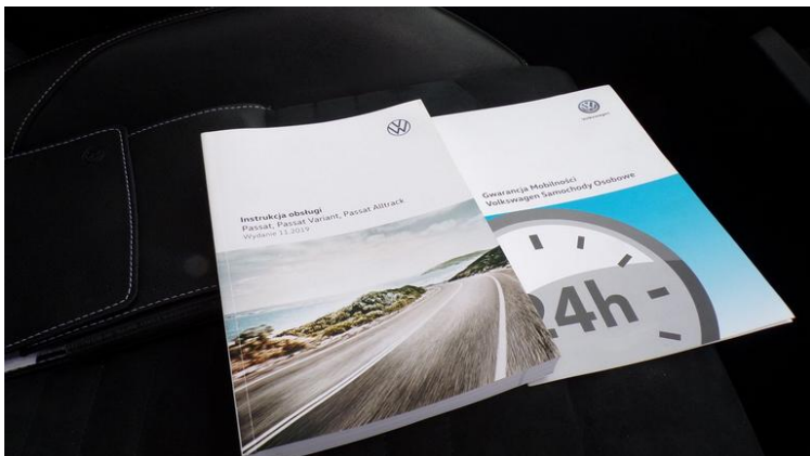
Fot. nr 89