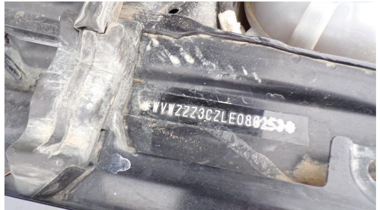
Fot. nr 86