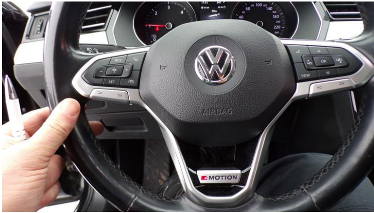
Fot. nr 79