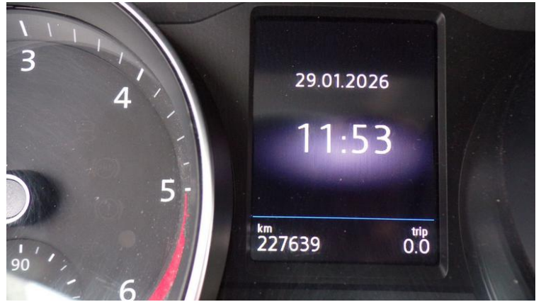
Fot. nr 80