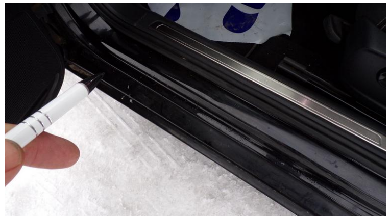
Fot. nr 84