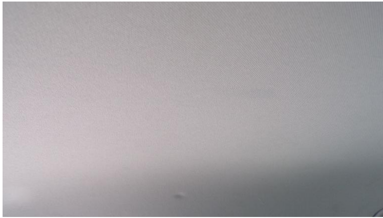
Fot. nr 91