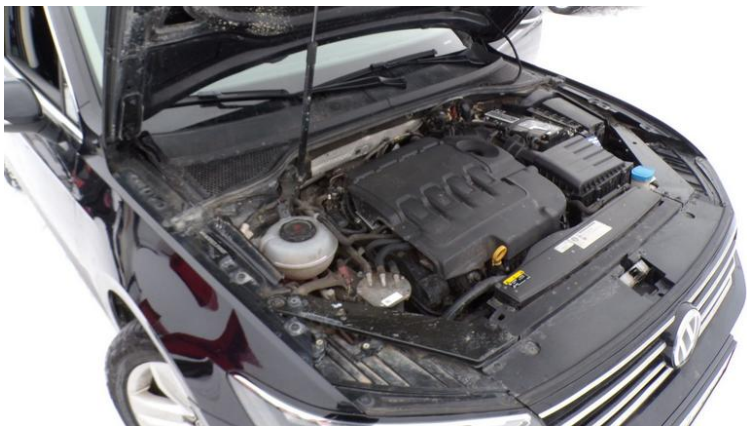
Fot. nr 87