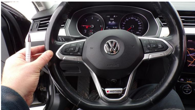
Fot. nr 77