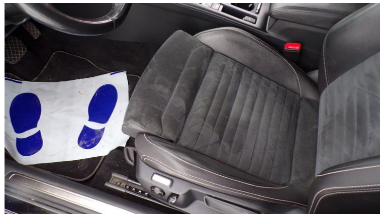
Fot. nr 88