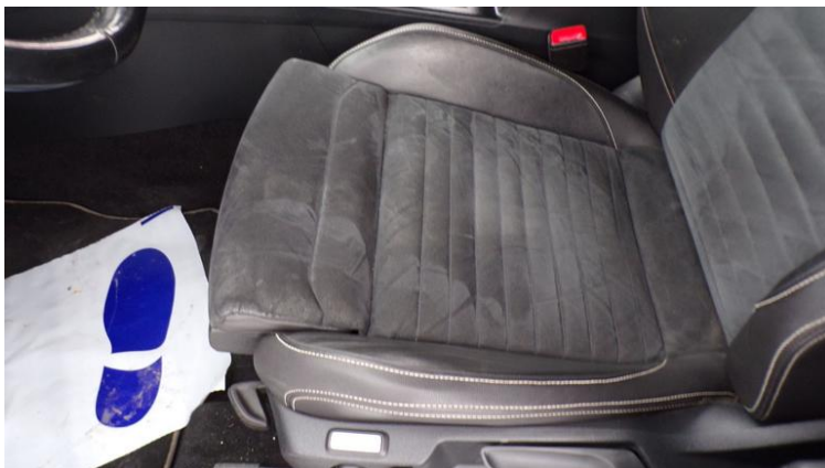
Fot. nr 83