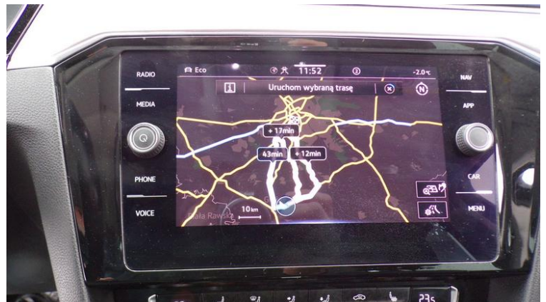
Fot. nr 76