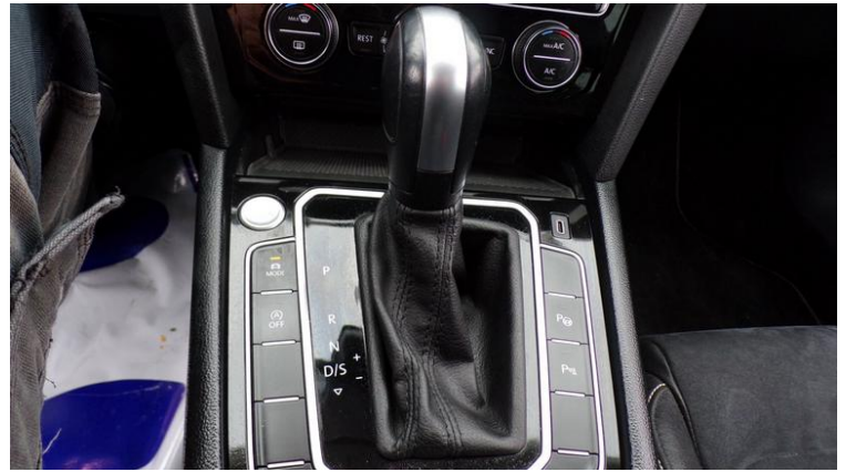
Fot. nr 92

Dokument wystawiony elektronicznie, wamy bez podpisu