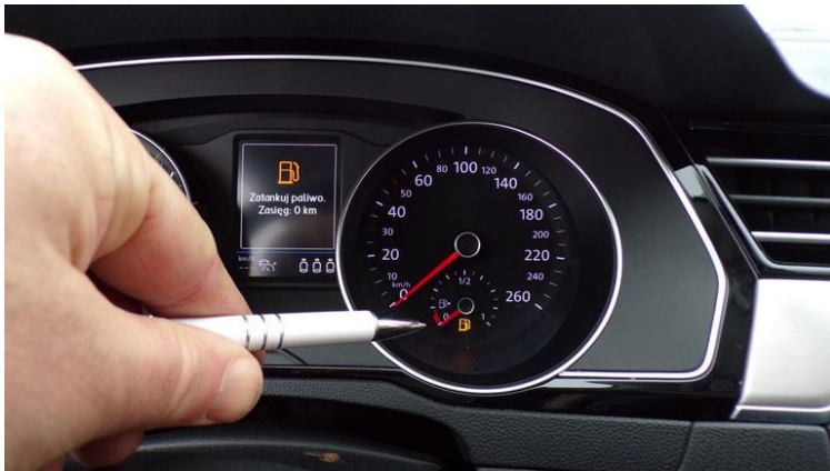
Fot. nr 81