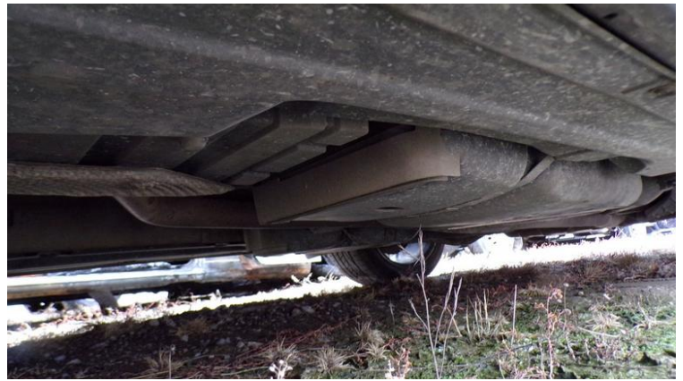
Fot. nr 82