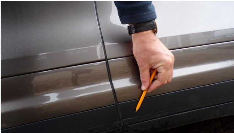
Fot. nr 89