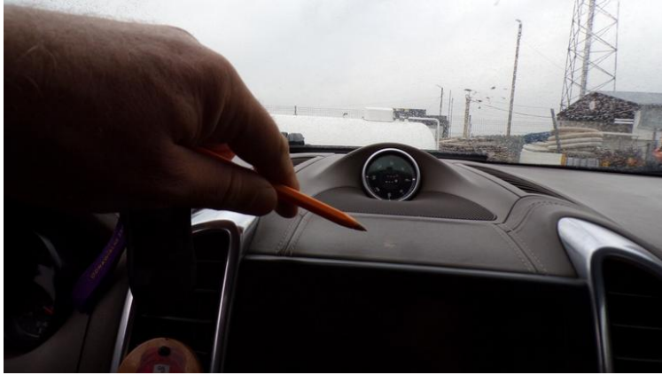
Fot. nr 103