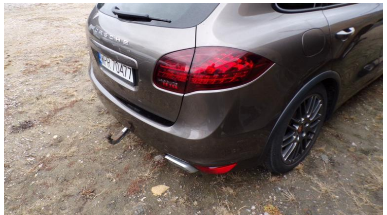
Fot. nr 108