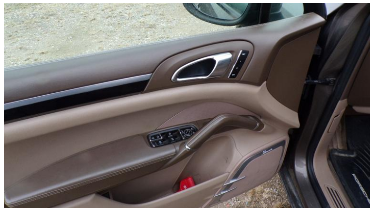
Fot. nr 96