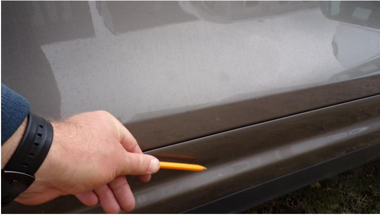
Fot. nr 87