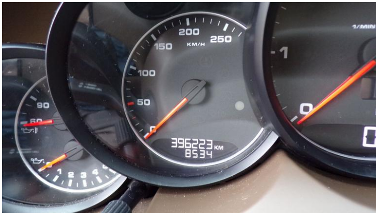
Fot. nr 99