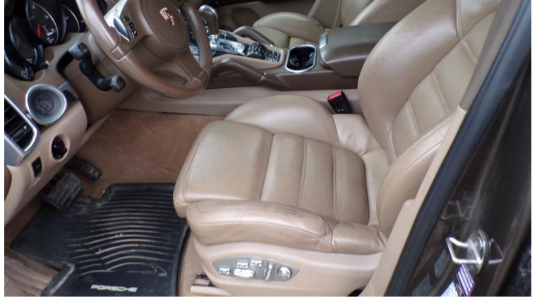
Fot. nr 98