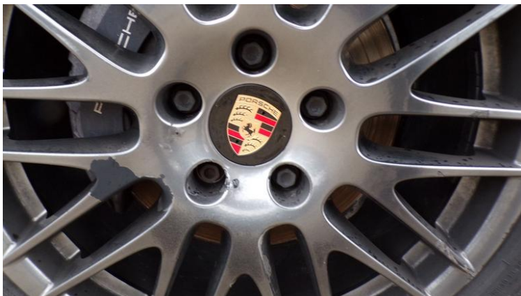
Fot. nr 95