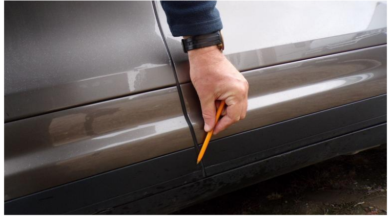
Fot. nr 88