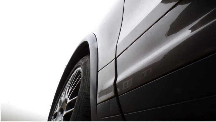
Fot. nr 85