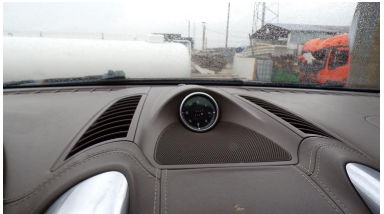
Fot. nr 100