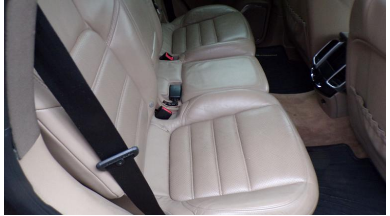
Fot. nr 92