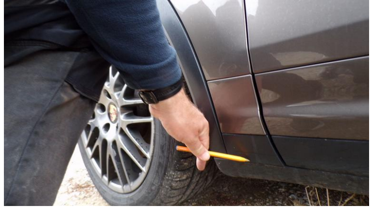
Fot. nr 86