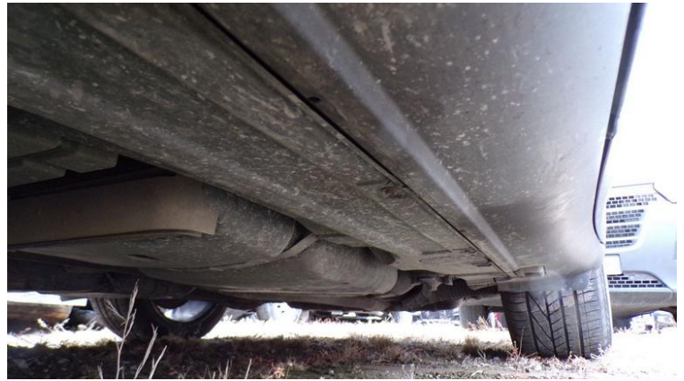
Fot. nr 84