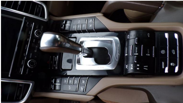
Fot. nr 101