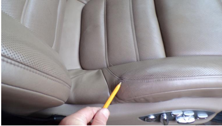
Fot. nr 91