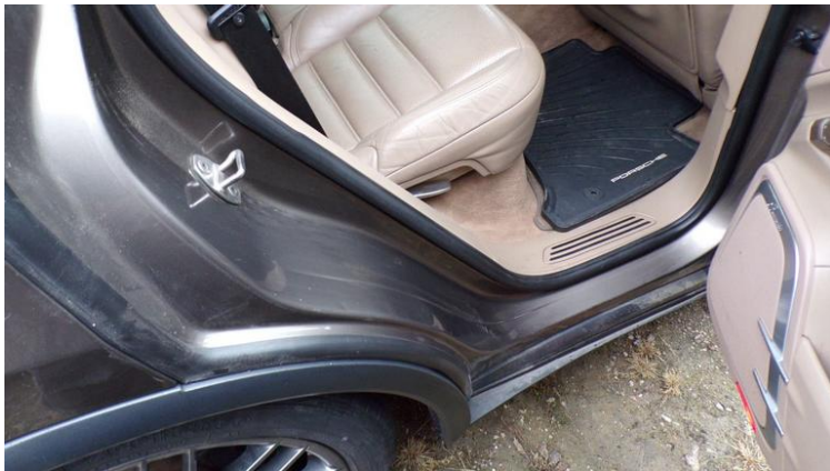
Fot. nr 93