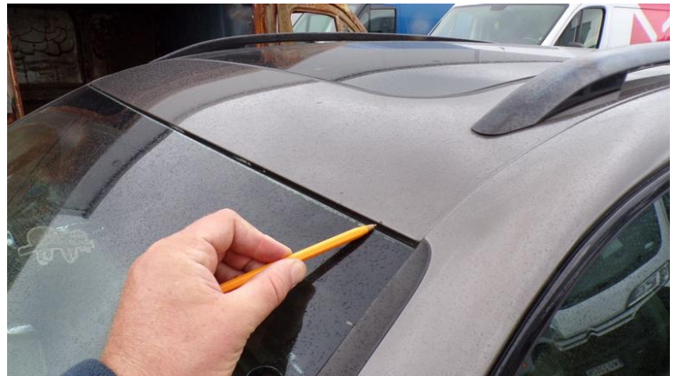
Fot. nr 94