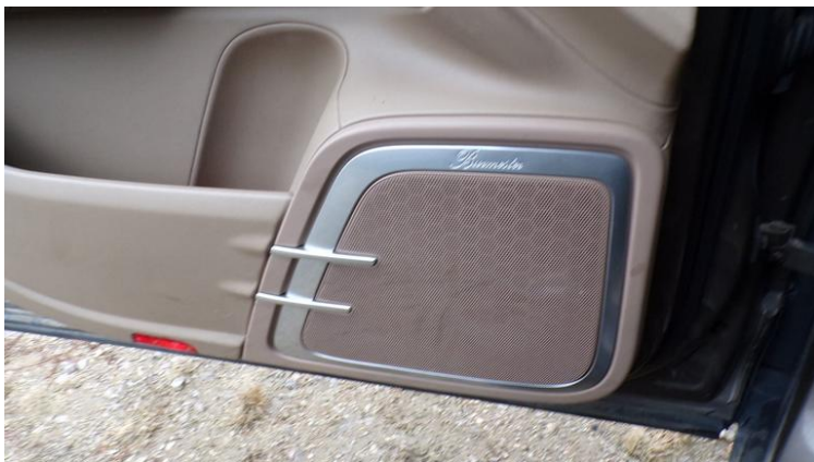
Fot. nr 107