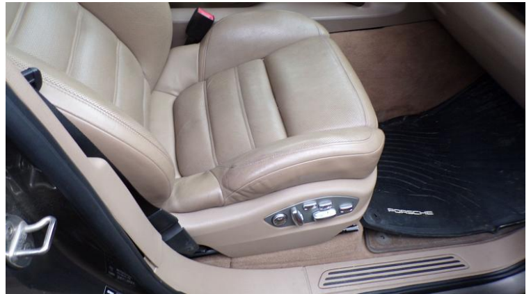
Fot. nr 90