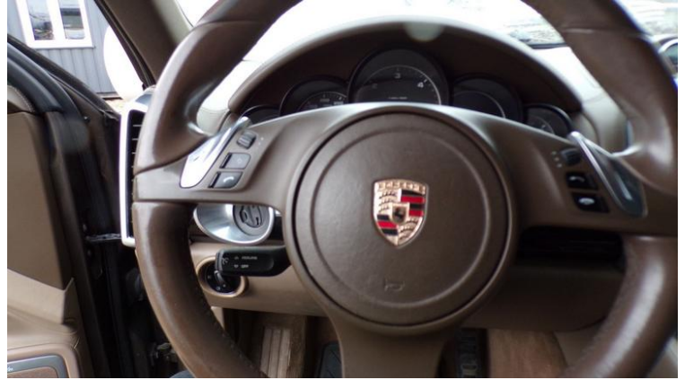
Fot. nr 104