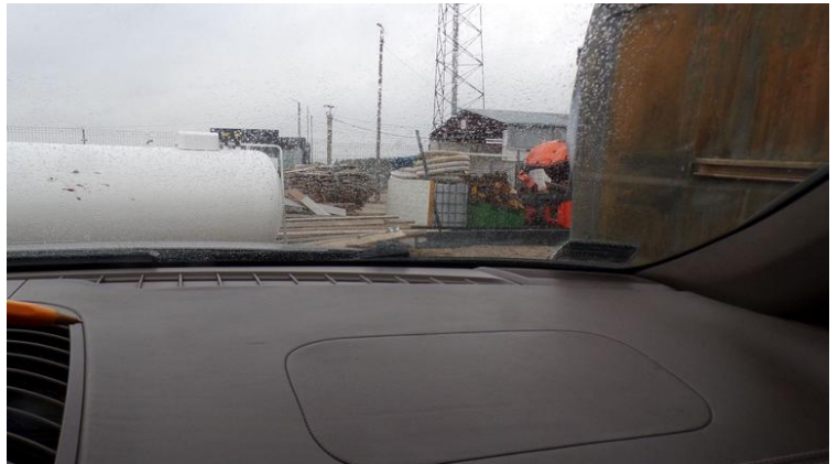
Fot. nr 102