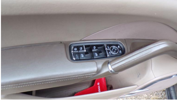
Fot. nr 97