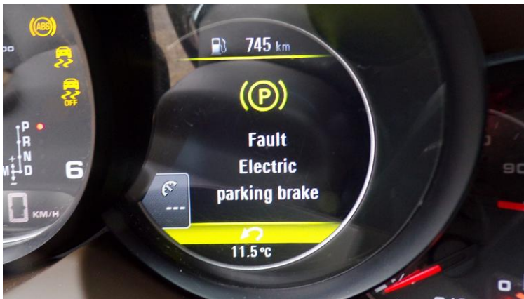
Fot. nr 105