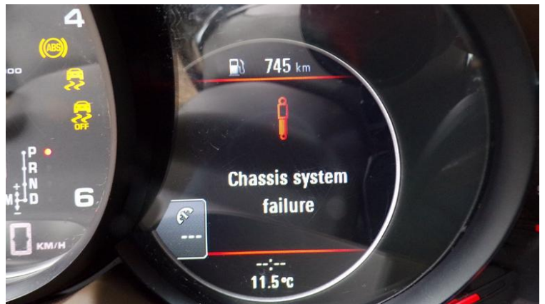
Fot. nr 106