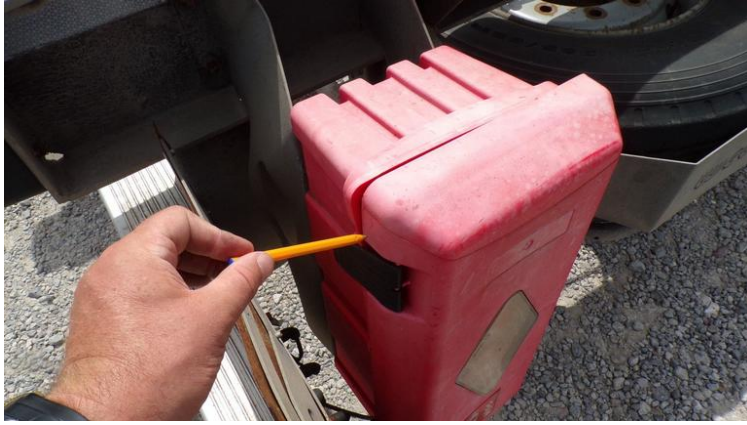
Fot. nr 67

Dokument wystawiony elektronicznie, wamy bez podpisu