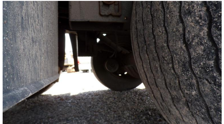
Fot. nr 78