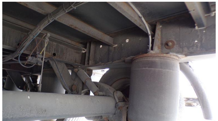
Fot. nr 84