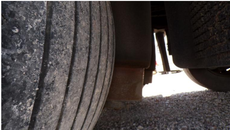
Fot. nr 77