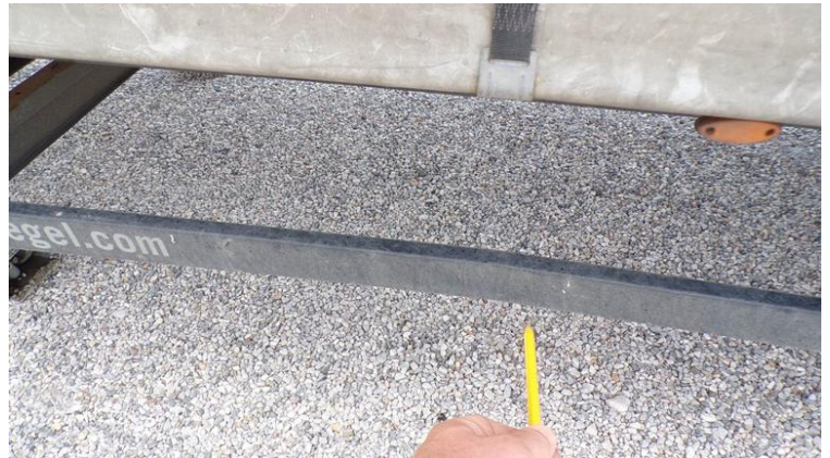
Fot. nr 72