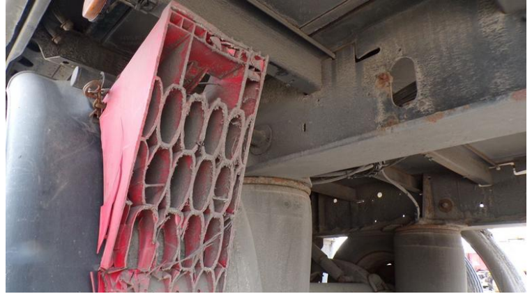
Fot. nr 80