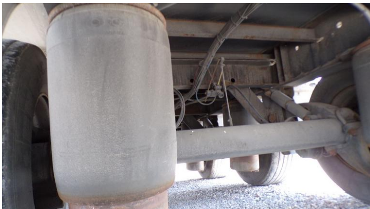
Fot. nr 83