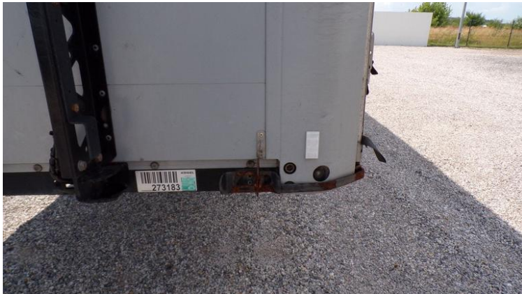
Fot. nr 71