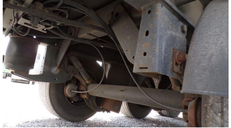
Fot. nr 74