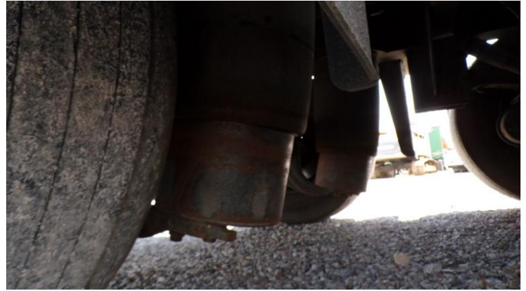
Fot. nr 76