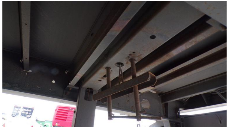
Fot. nr 82