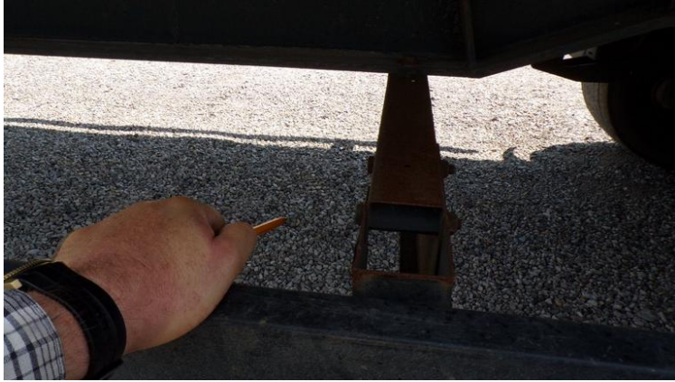
Fot. nr 73