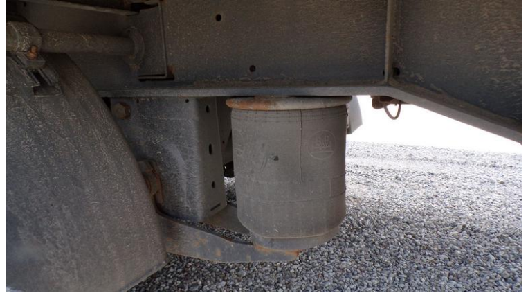
Fot. nr 68