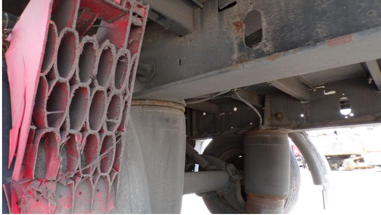
Fot. nr 79