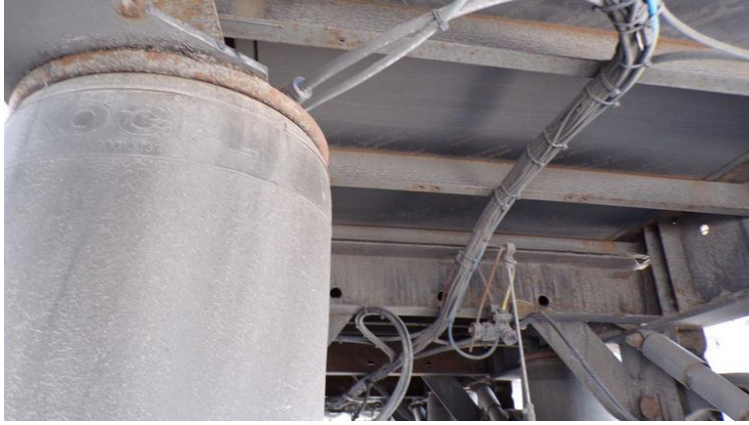
Fot. nr 85

Dokument wystawiony elektronicznie, wany bez podpisu