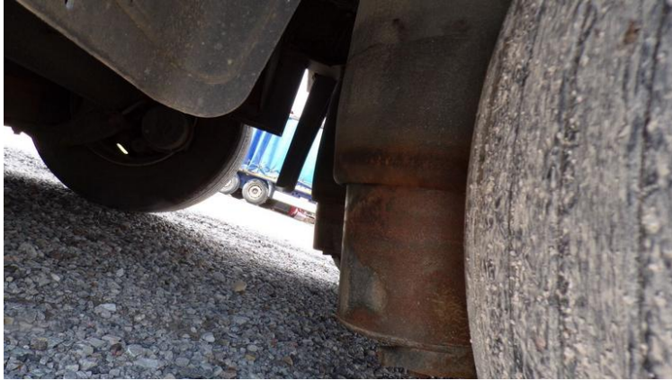
Fot. nr 67