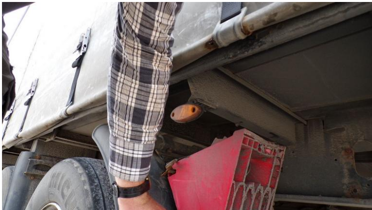
Fot. nr 81