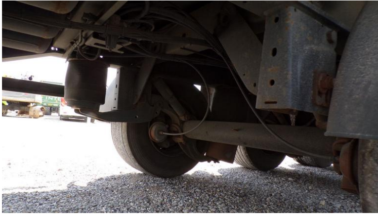
Fot. nr 75