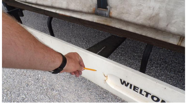
Fot. nr 74