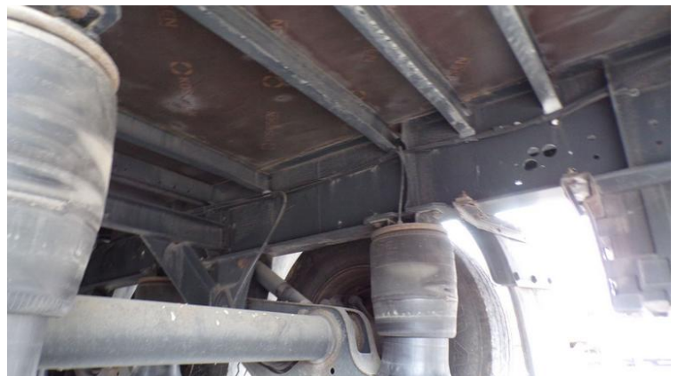
Fot. nr 78