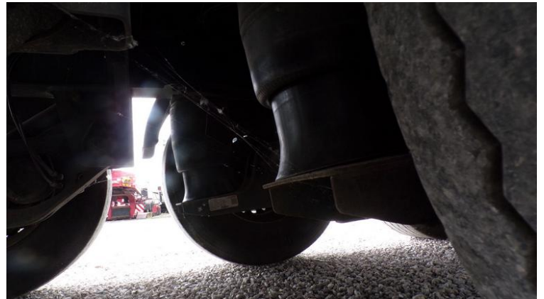
Fot. nr 72