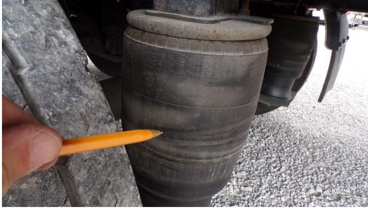
Fot. nr 79