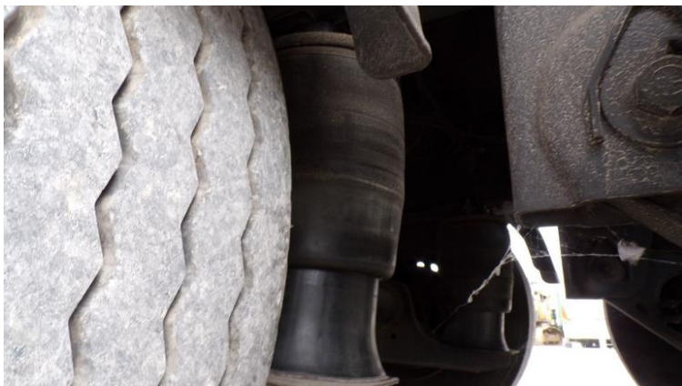
Fot. nr 77