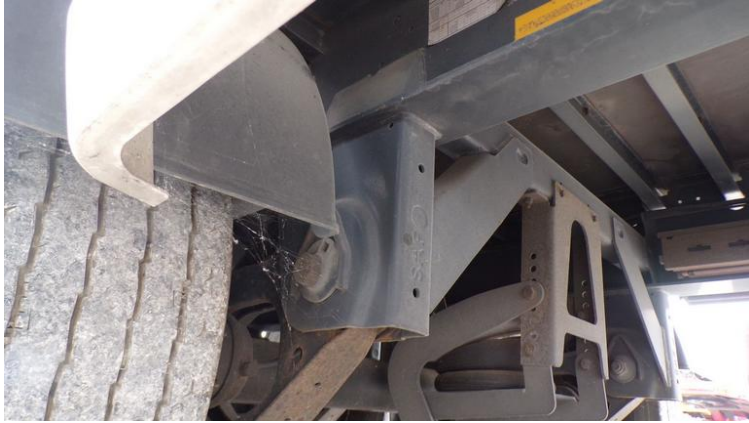
Fot. nr 73