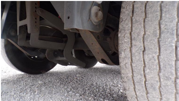
Fot. nr 75