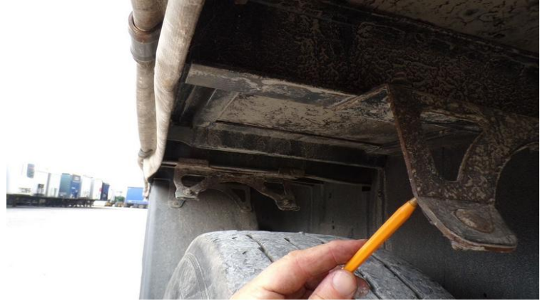
Fot. nr 80