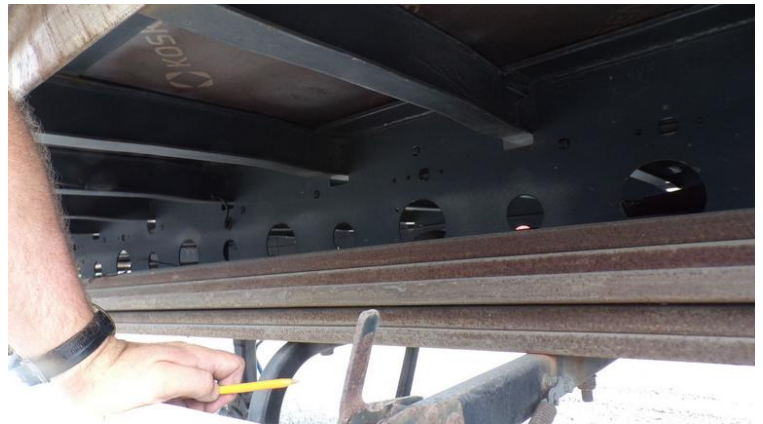
Fot. nr 76