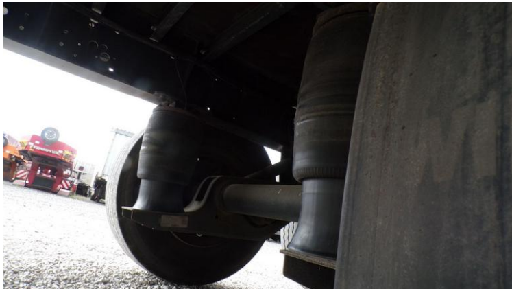
Fot. nr 71