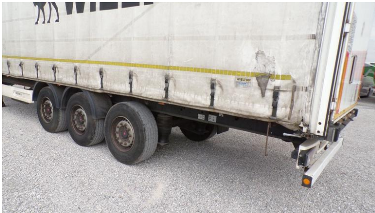
Fot. nr 81

Dokument wystawiony elektronicznie, wamy bez podpisu